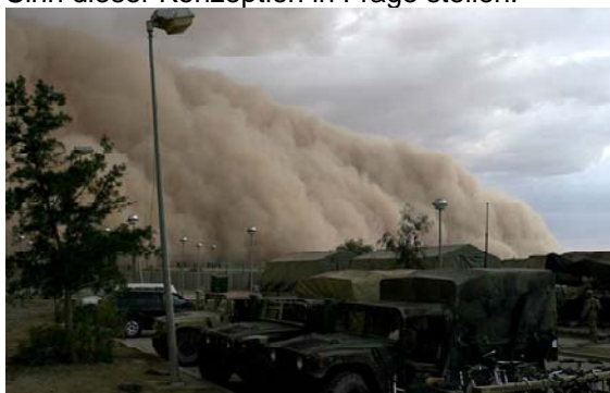
Abb. 1 Sandsturm in Al Asad, Irak

Bis 2050 soll Europa damit eine hundertprozentige regenerative Stromversorgung garantiert werden, und tausende neue Jobs entstünden in den Ländern rund um das Mittelmeer. Doch bei genauem Hinsehen tauchen eine Reihe von Fragen auf, die den Sinn dieser Konzeption in Frage stellen.