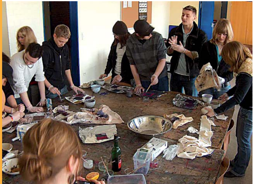
Unsere Färberwerkstatt in der Gesamtschule Essen Süd.