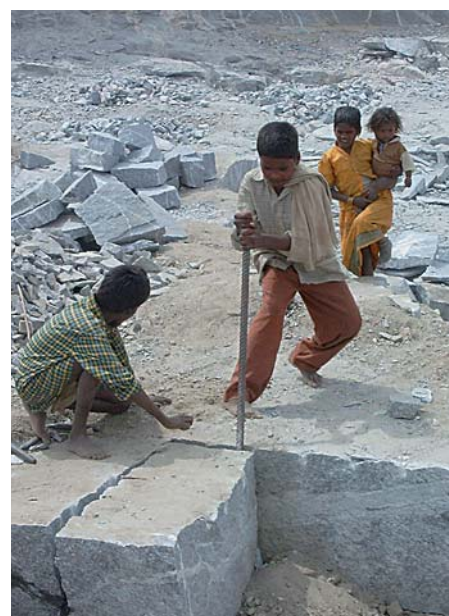
Kinderarbeit in Indien für Grabsteine in Deutschland.

Die öffentliche Hand gibt im Jahr rund 360 Mrd. Euro für Güter und Dienstleistungen aus, die Hälfte davon entfällt auf die Kommunen. Städte kaufen Dienstkleidung, Lebensmittel, Steine, Holz, Blumen, Computer und vieles mehr. Mit der Kampagne »Fair Kaufen. Mehr Wert für alle!« will das Eine Welt Netz erreichen, dass bei den kommunalen Einkaufstouren verstärkt auf soziale und ökologische Verträglichkeit geachtet wird. Workshops und Fachtagungen für Politiker und Verwaltungsmitarbeiter klären über die rechtlichen Möglichkeiten auf, um z.B. Ausschreibungen entsprechend zu formulieren. ■