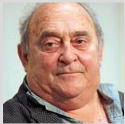
Denis Goldberg Anti-Apartheidskämpfer

Wir können zwar sagen, dass die Apartheid erfolgreich bekämpft worden ist. Aber in den Köpfen vieler Menschen lebt der Rassismus weiter, und es wird noch Generationen dauern, bis wir dies überwunden haben. In der kurzen Zeit von 17 Jahren haben wir große Fortschritte gemacht und wir wissen, dass es noch viel mehr zu tun gibt.