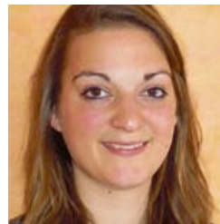
Julia Bieber Open Globe

Junge Menschen sollten so früh wie möglich über die Zusammenhänge von lokalem Handeln und den globalen Folgen informiert werden, um sie für die Eine-Welt-Arbeit zu motivieren. Es ist wichtig, die Handlungsoptionen für Einzelne aufzuzeigen.