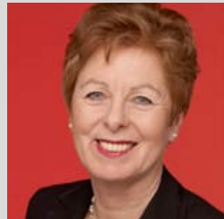
Dr. Angelica Schwall-Düren Ministerin für Bundesangelegenheiten, Europa und Medien des Landes NRW

Ich setze mich dafür ein, dass im Beschaffungswesen des Landes zukünftig soweit möglich fair gehandelte Produkte – vom Kaffee über die Blumen bis zur Dienstkleidung – berücksichtigt werden.